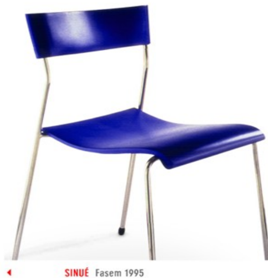
◀ SINUÉ Fasem 1995