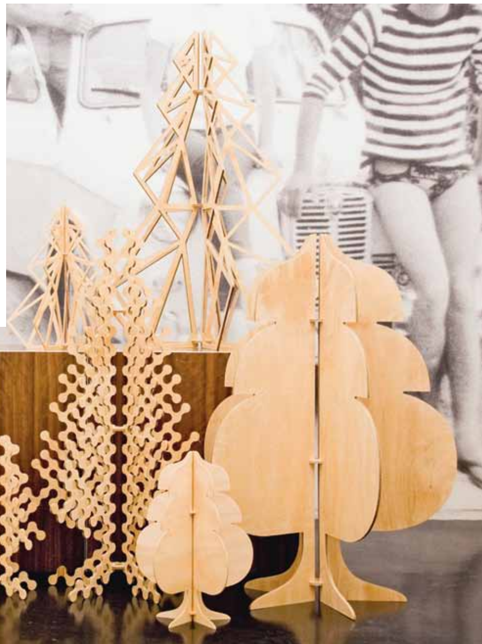
Borovi fenyőből készített rétegelt lemez, amelyet lézervágással alakítottak különböző méretű karácsonyfákká. A több karácsonyt is kiszolgáló Buro Tree kollekción az ausztrál Büro North tervező-csapat jegyzi www.burotree.com

Aki valóban ökotudatos életet él, jól ismeri a világháló magyar oldalain itt-ott olvasható, kissé ironikus mondatot, mely szerint ma mindenki környezetvédő, de senki nem száll ki az autójából. A honi privát autóhasználat túlzásairól számtalanszor írtak már, de úgy tűnik, hogy sokaknak nem csupán a motorizációhoz való hozzáállásán lenne érdemes változtatni